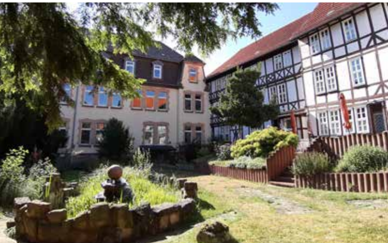
Paradiesgarten des Klosters